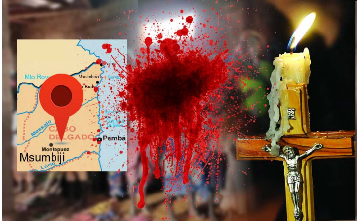
കഷ്ടപ്പെടുന്ന തങ്ങളുടെ സഹോദരങ്ങൾക്കായി പ്രാർത്ഥിക്കണമെന്ന് അദ്ദേഹം അഭ്യർത്ഥിച്ചു.

കാബോ ഡെൽഗാഡോ: ആഫ്രിക്കൻ രാജ്യമായ മൊസാംബിക്കിലെ ഗ്രാമത്തിൽ ഇസ്ലാമിക് സ്റ്റേറ്റ് തീവ്രവാദികൾ ക്രൈസ്തവർക്ക് നേരെ അഴിച്ചുവിട്ട ആക്രമണത്തിൽ 11 പേർ കൊല്ലപ്പെട്ടു. സെപ്തംബർ 15നു കാബോ ഡെൽഗാഡോ പ്രവിശ്യയിലെ മോക്കിംബോവ ഡാ പ്രയ ജില്ലയിൽ സ്ഥിതി ചെയ്യുന്ന നാകിറ്റേൻഗ് ഗ്രാമത്തിൽ നടത്തിയ ക്രൈസ്തവ കുട്ടക്കൊലയുടെ വിവരങ്ങൾ കത്തോലിക്ക സന്നദ്ധ സംഘടനയായ എയിഡ് ടു ദ ചർച്ച് ഇൻ നീഡ് (എസിഎൻ) ഇന്റർനാഷണലാണ് പുറത്തുവിട്ടിരിക്കുന്നത്. ഗ്രാമത്തിൽ എത്തിയ ഇസ്ലാമിക് സ്റ്റേറ്റ് തീവ്രവാദികൾ ക്രിസ്ത്യാനികളെ പേരുകളുടെ അടിസ്ഥാനത്തിൽ, മുസ്ലീങ്ങളിൽ നിന്ന് വേർപെടുത്തിയ ശേഷം ക്രൈസ്തവർക്ക് നേരെ വെടിയുതിർക്കുകയായിരുന്നുവെന്ന് എ സിഎൻ റിപ്പോർട്ട് ചെയ്യുന്നു.