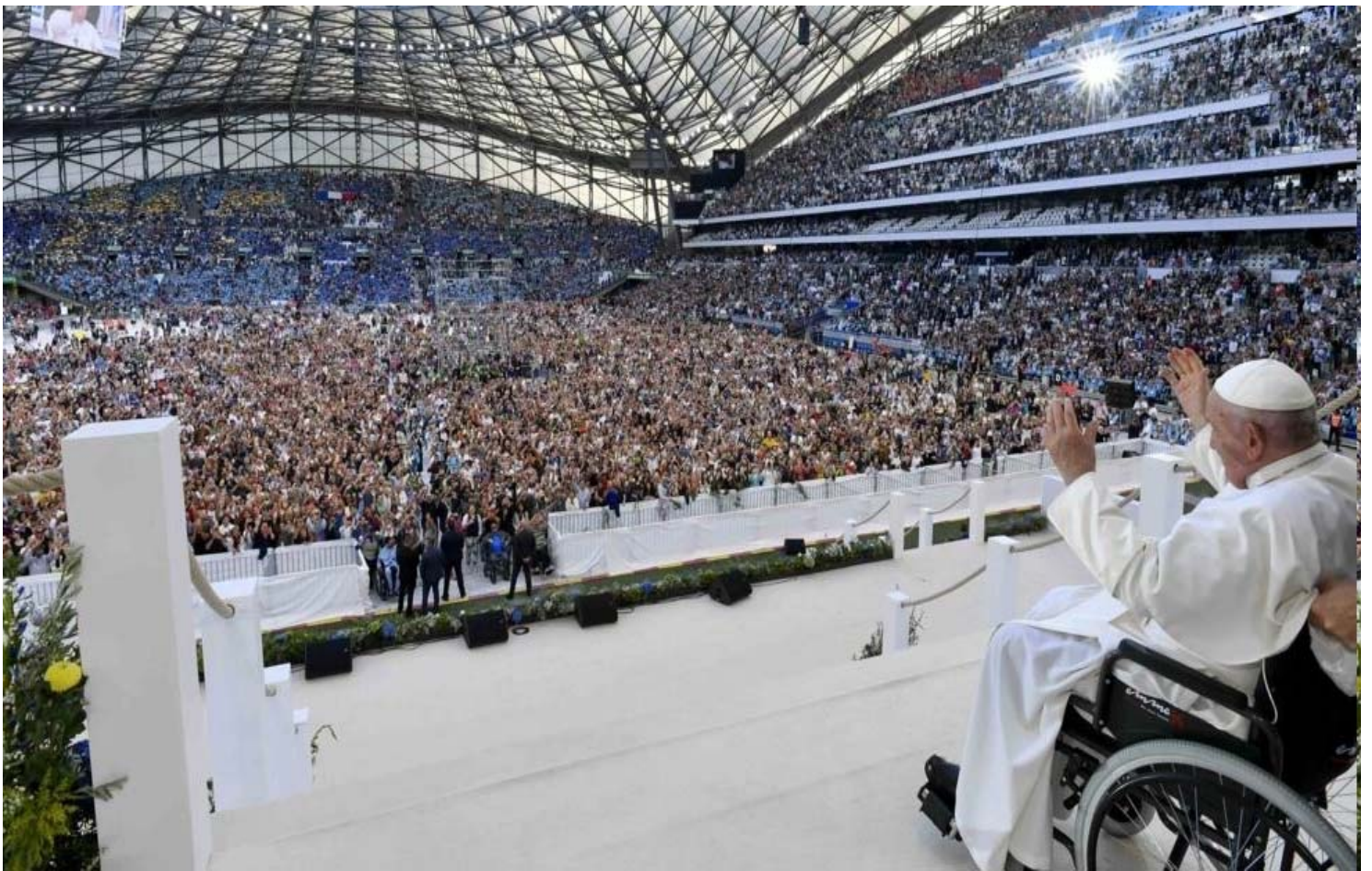
Pope Francis waves to the crowd during a holy mass at the Vélodrome stadium in Marseille, southern France.