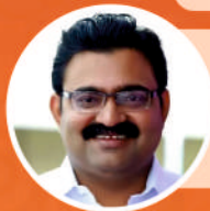
Adv. M ANILKUMAR Mayor | Kochi