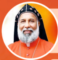
CARDINAL BASELIOS CLEEMIS CATHOLICOS President | Kcbe