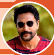
Mr. BABU ANTONY Actor